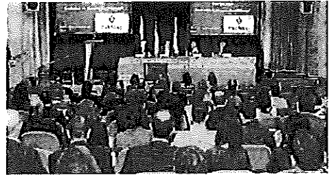
Las ponencias, que se desarrollan en La Magdalena, concluirán mañana viernes con una clausura oficial.

Medio millar de profesionales de la Medicina y Seguridad del Trabajo debaten desde ayer en La Magdalena sobre la salud en el trabajo y, fundamentalmente, sobre la prevención de las enfermedades originadas en el puesto de trabajo. El XII Congreso de la Sociedad Española de Medicina y Seguridad en el Trabajo, que concluirá mañana, viernes, sirvió además para poner de manifiesto las carencias y la falta de compromiso de las administraciones de esta especialidad de la Medicina.